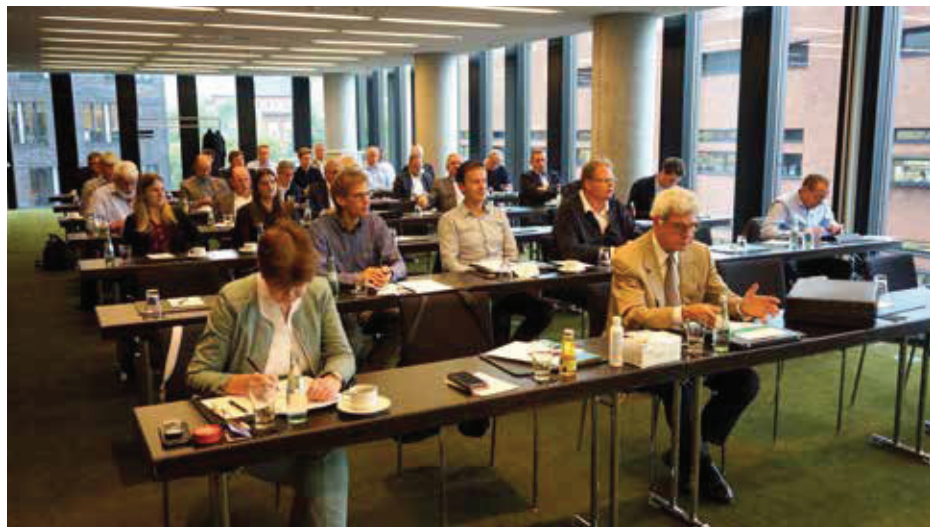
Vorstand und Mitglieder des DKHV trafen sich zur ersten Präsenzveranstaltung in Hamburg, der traditionellen für alle Mitglieder offenen Vorstandssitzung.

Eine erfolgreiche Veranstaltung – das war das Resümee der Teilnehmenden nach dem Treffen – und sie äußerten die Hoffnung, dass solche anregenden Diskussionen auch künftig möglich sein müssen. <<