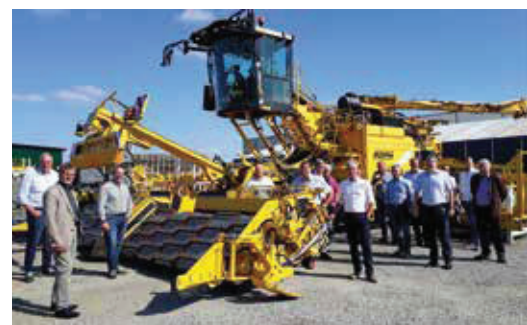
Das zur Generalversammlung ergänzende Fachprogramm führte die Teilnehmer u. a. zur ROPA Fahrzeug- und Maschinenbau GmbH in Sittelsdorf.

Delegierten vom 24.–26. August 2021 in Weichering, Gastgeber war die Südstärke Kartoffelliefergenossenschaft eG in Schrobhausen. <<